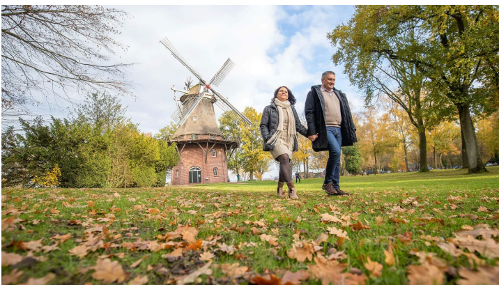
muehle-kurpark-im-herbst.jpg