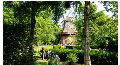
muehle-hinter-pflanzen - - info@bad-zwischenahn-touristik.de