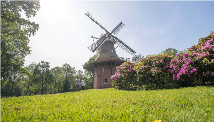
Rhododendron-Mühle-Freilichtmuseum.jpg - - info@bad-zwischenahn-touristik.de