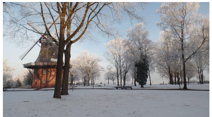
kurpark-muehle-im-schnee.jpg