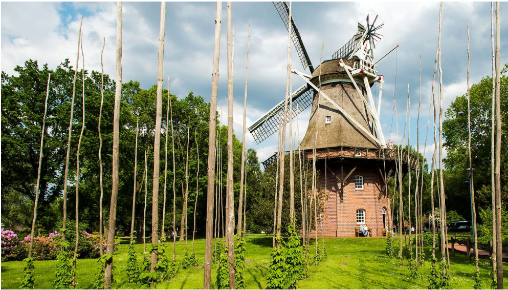
bepflanzung-vor-der-muehle

Sonntag und an Feiertagen: 11 bis 17 Uhr