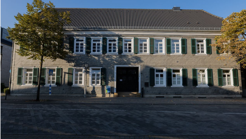
Standesamt Gütersloh - © Lena Descher

Quelle: destination.one ID: p_100038434 Zuletzt geändert am 13.01.2023, 11:55