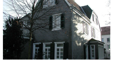
Kirchstraße Traueingang