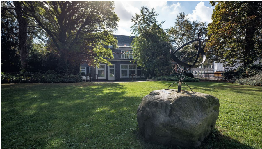
Villa Bartels - © Detlef Güthenke