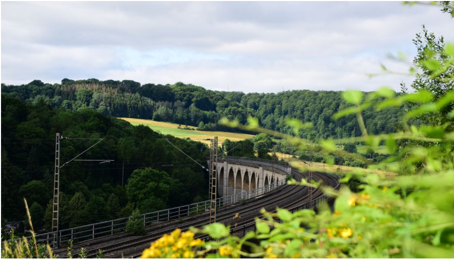
Großer Viadukt | Altenbeken