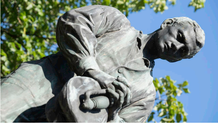
14-08 14-08 Rheda-Wiedenbrück-1667.jpg