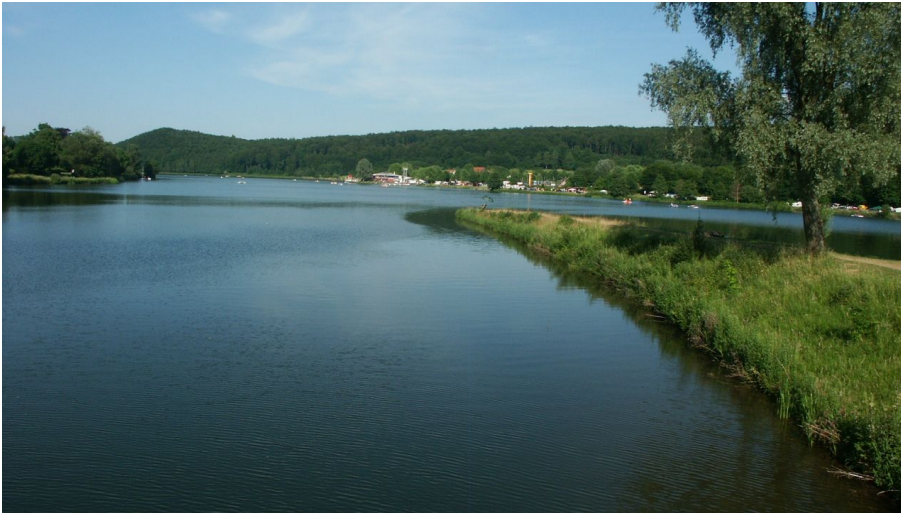
Blick auf den SchiederSee