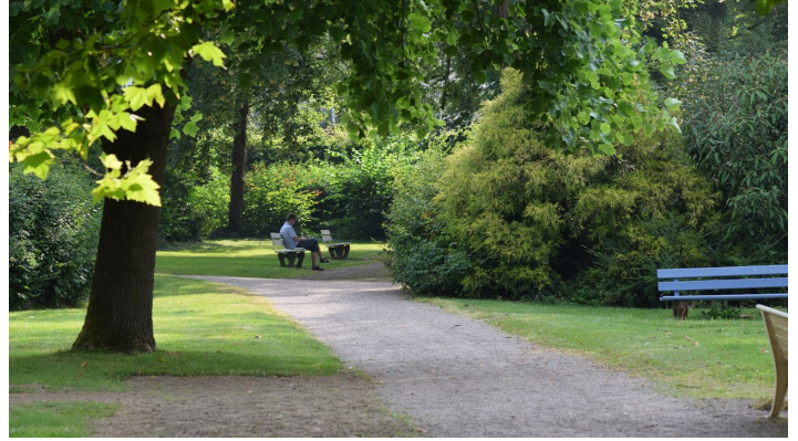
Historischer Kurpark