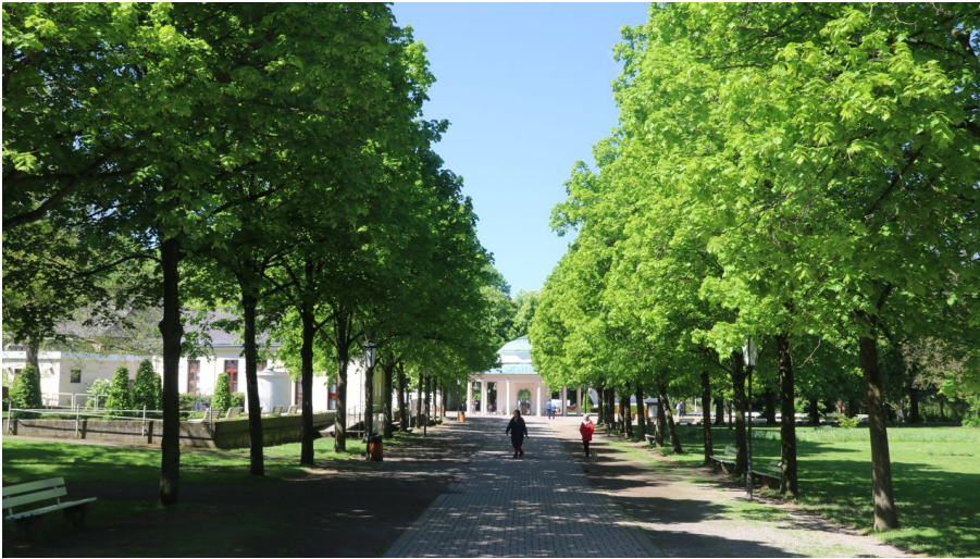
Historischer Kurpark mit Brunnentempel