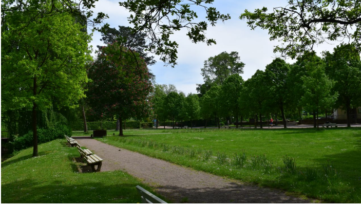
Historischer Kurpark

ID: p_100039501 Zuletzt geändert am 04.09.2024, 13:31