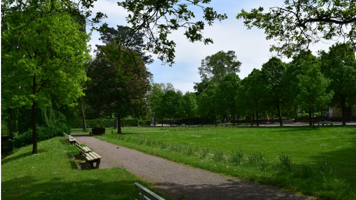
Historischer Kurpark