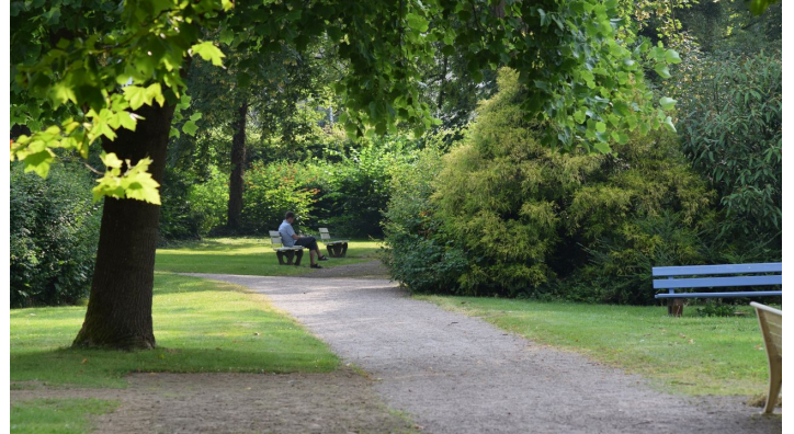
Historischer Kurpark