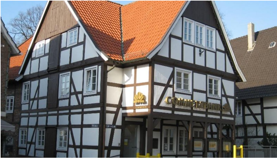
Ehem. Stadtmühle