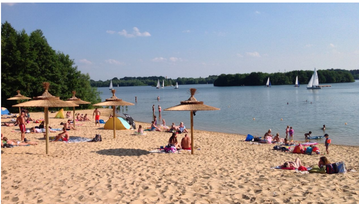
Sandstrand am Nordufer beim "Eisklang"-Bistro