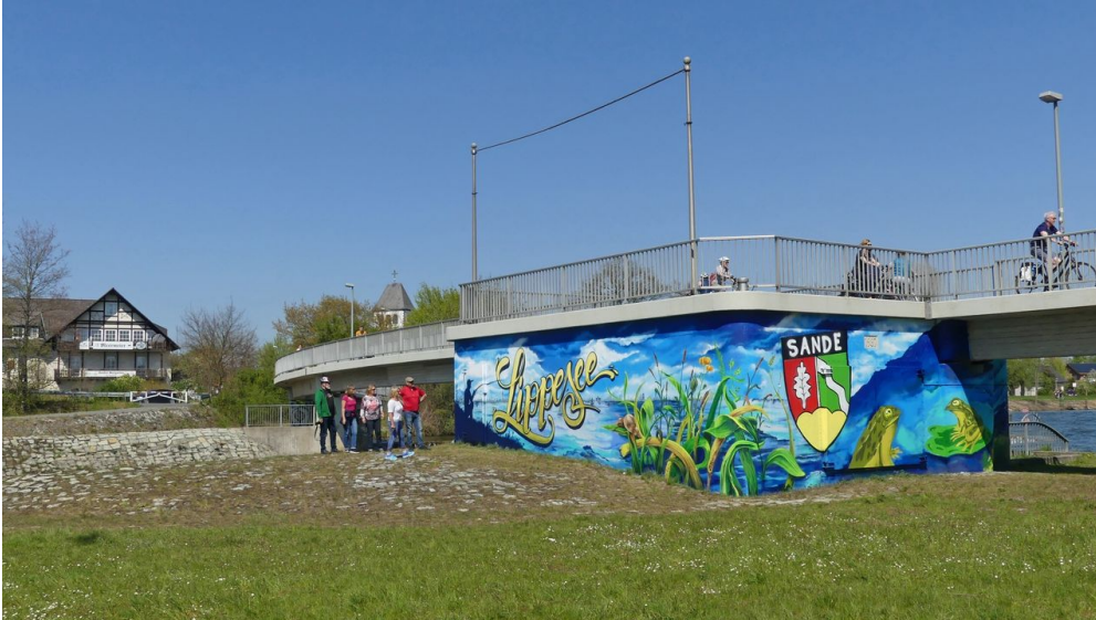
Graffiti am ehemaligen Kraftwerk bei der Fußgängerbrücke

Der Zutritt zum See ist kostenlos. Ausnahmen sind der Badestrand sowie der benachbarte Wasserskisee, bei denen Eintrittsgelder erhoben werden.