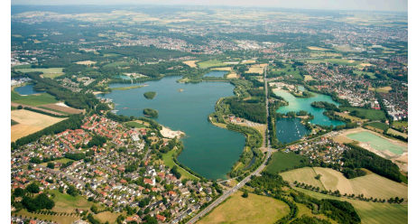
Luftbild: Paderborn-Sande und Lippensee