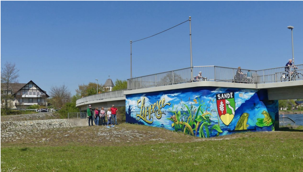
Graffiti am ehemaligen Kraftwerk bei der Fußgängerbrücke

Der Zutritt zum See ist kostenlos. Ausnahmen sind der Badestrand sowie der benachbarte Wasserskisee, bei denen Eintrittsgelder erhoben werden.