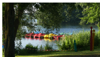
Tretboote am Steg der Seemöwe