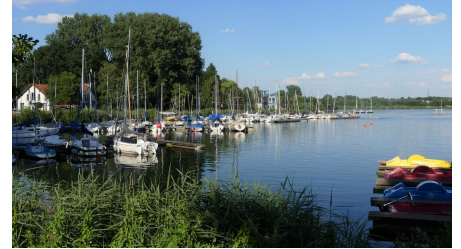
Segelboote am Steg