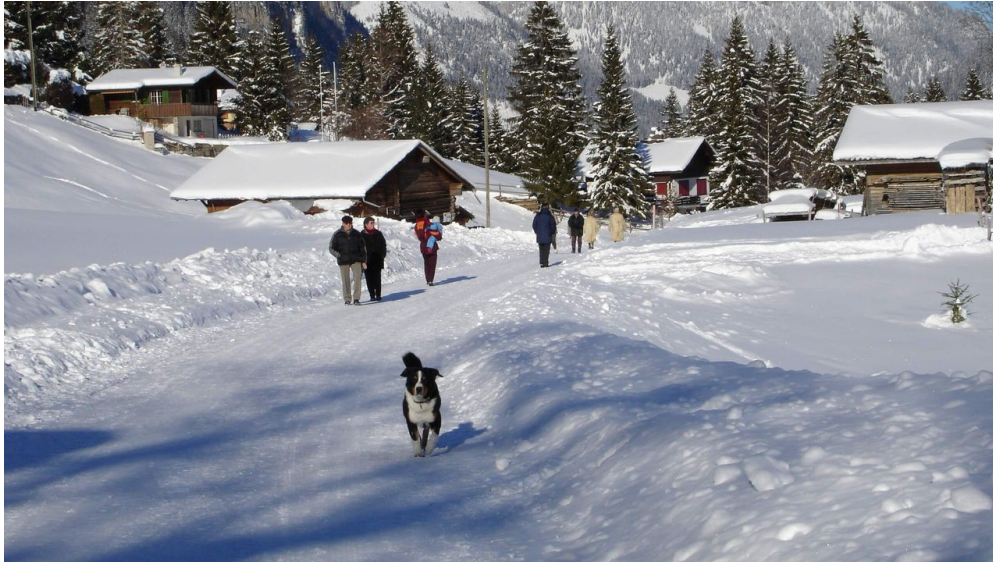
Erb Sport, Diemtigtal, Interlaken Tourismus - web@interlaktourismus.ch

Pendant la saison de ski, tous les jours de 9 à 16.30h