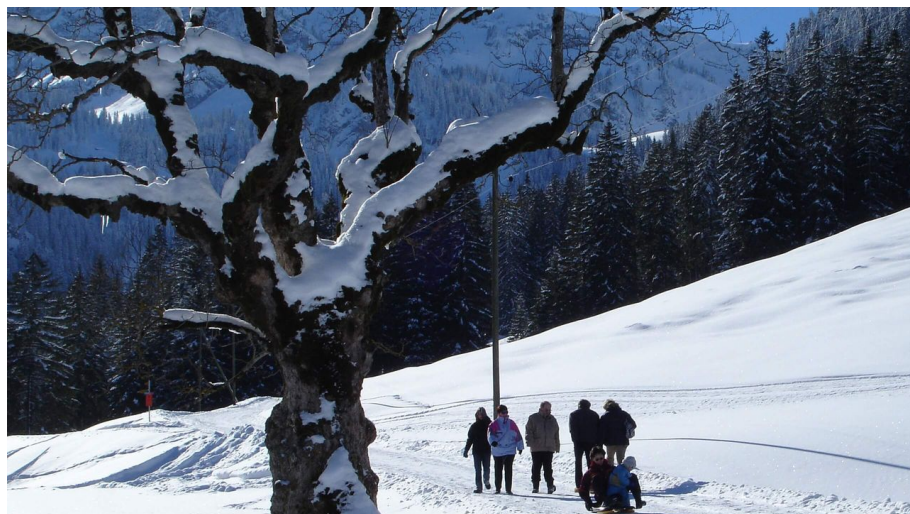
Erb Sport, Diemtigtal, Interlaken Tourismus - web@interlaketourism.ch