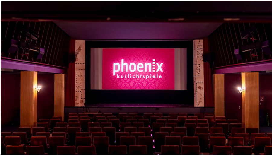
phoenix Kurlichtspiele Kinosaal - - kino@badnenndorf.de