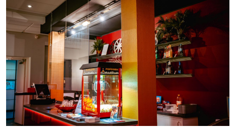
Phoenix Kurlichtspiele Foyer