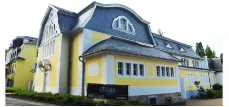
Außenansicht phönix