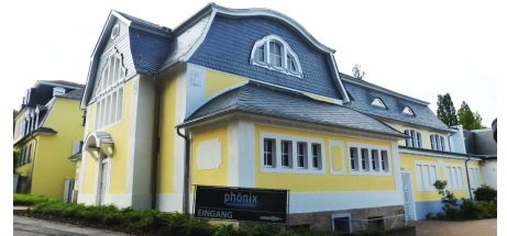
Außenansicht phönix