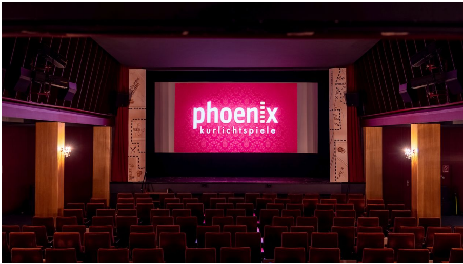
phoenix Kurlichtspiele Kinosaal