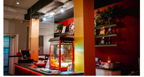
Phoenix Kurlichtspiele Foyer