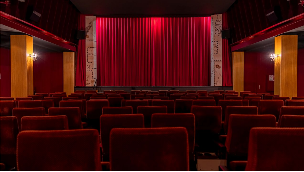
Phoenix Kurlichtspiele Kinosaal