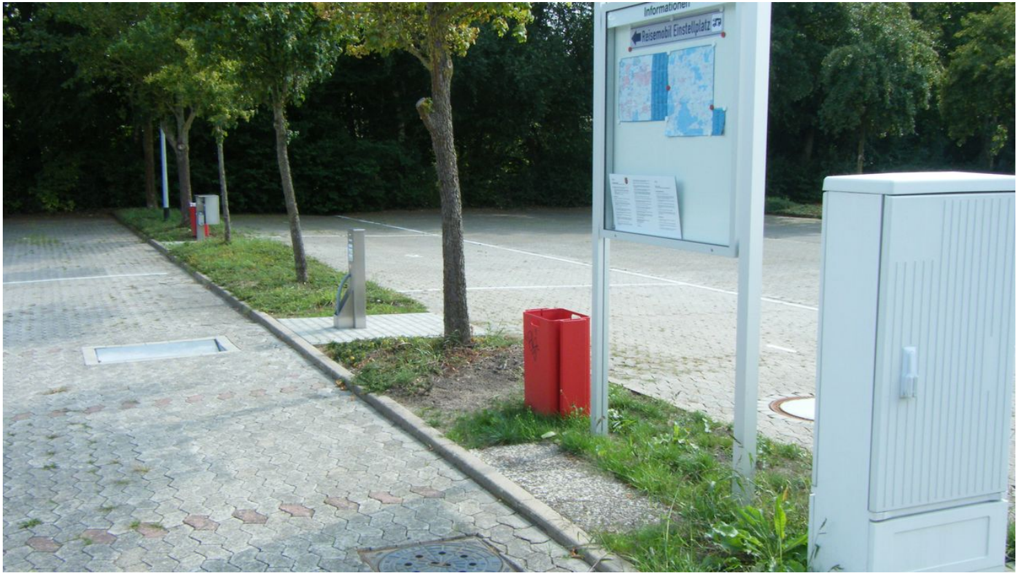
Wohnmobilstellplatz Wittigen - © Stadt Wittigen