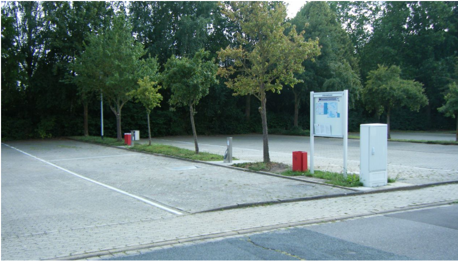
Wohnmobilstellplatz Wittingen