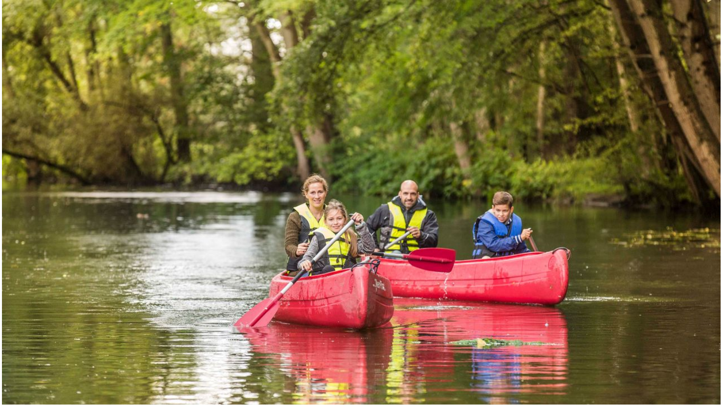
Kanutour auf der Oker