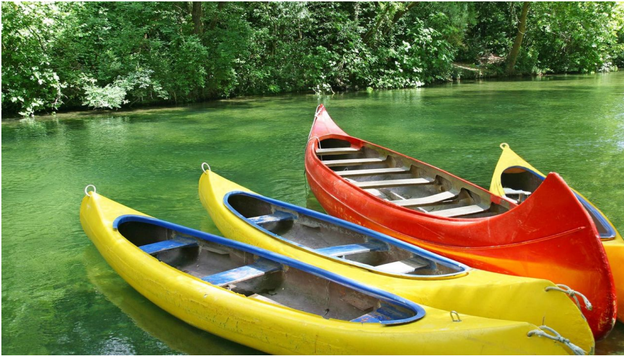
Kanuverleih am Stadtbad