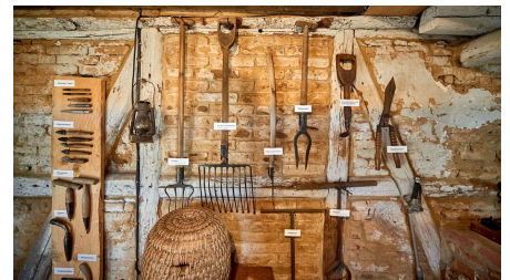
Gärtnermuseum Wolfenbüttel