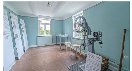
Gärtnermuseum Wolfenbüttel