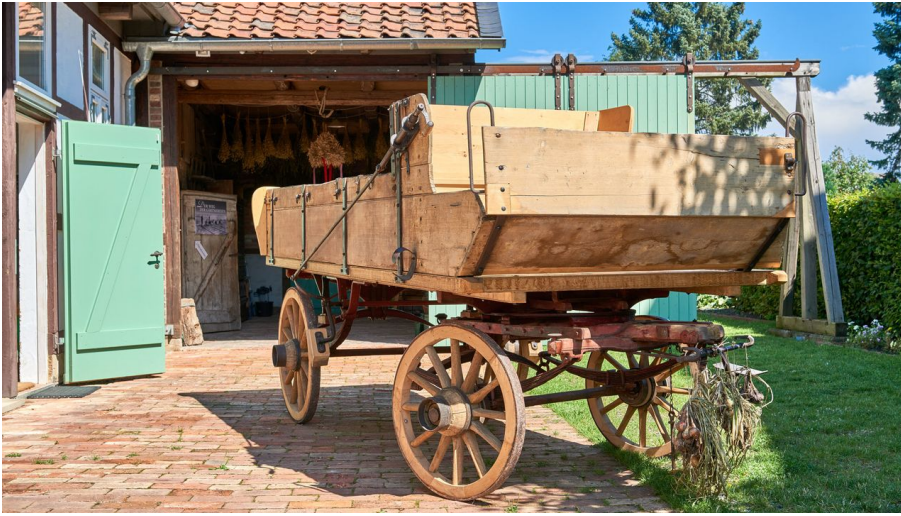
Gärtnermuseum Wolfenbüttel