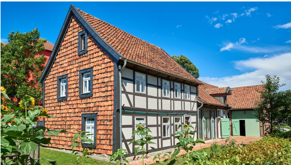
Gärtnermuseum Wolfenbüttel

Das Gärtnermuseum bietet regelmäßig einen Tag der offenen Tür und diverse Themenveranstaltungen an. Nähere Informationen dazu auf www.gaertnermuseum.de .