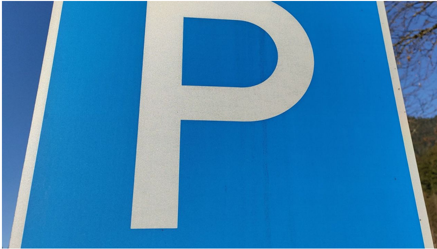
Parkplatz Schild