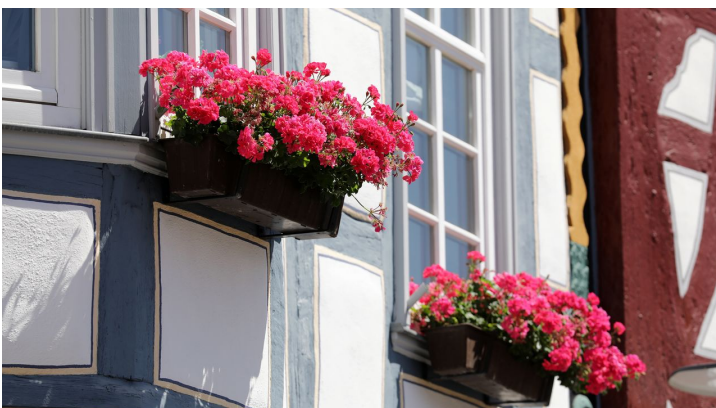
052HR - Bad Camberg - Stadtmitte.JPG