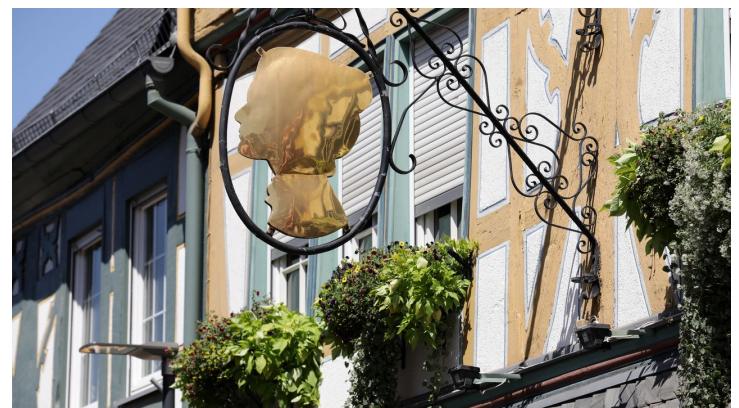
050HR - Bad Camberg - Stadtmitte.JPG