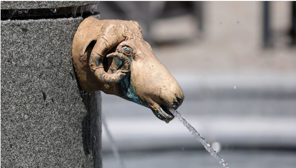
064HR - Bad Camberg - Stadtmitte Brunnen.JPG