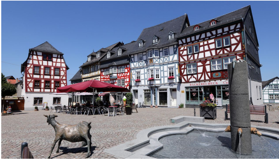
Bad Camberg - Stadtmittie