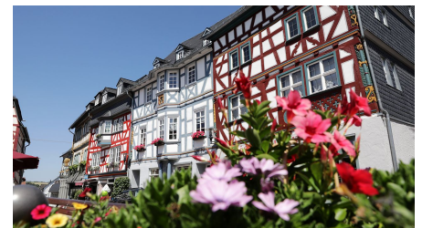
045HR - Bad Camberg - Stadtmitte.JPG