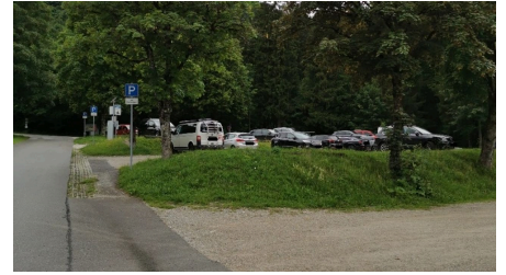
Parkplatz Pürschling 3.jpg