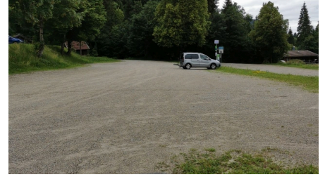
Parkplatz Pürschling 2.jpg - © b4a98bda-80f0-443d-8e25-fd669a575309