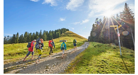
Hörnle Barfuß _Gert Krautbauer W5A9616.jpg