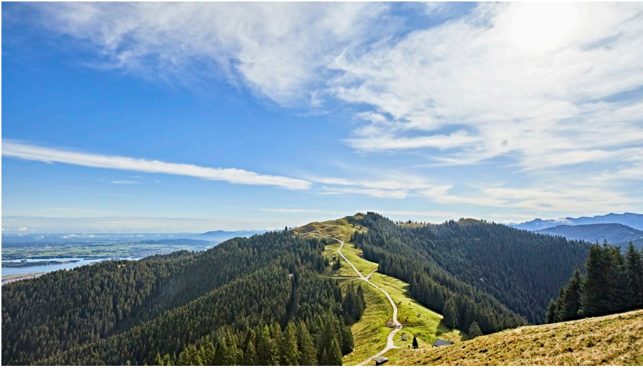
Hörnle Barfuß _ Gert Krautbauer W5A0061.jpg