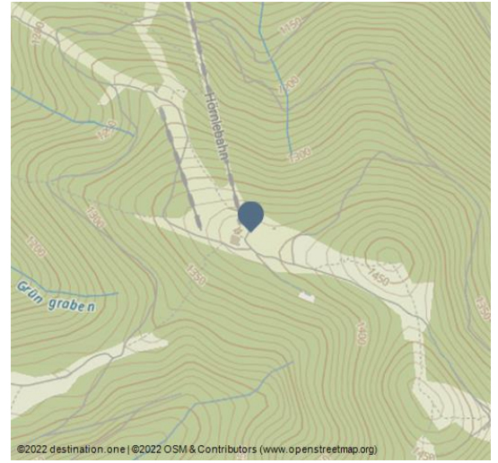
©2022 destination.one | ©2022 OSM & Contributors (www.openstreetmap.org)