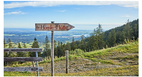
Zur Hörnlehütte _Gert Krautbauer W5A9505.jpg - © erlebe.bayern - Gert Krautbauer