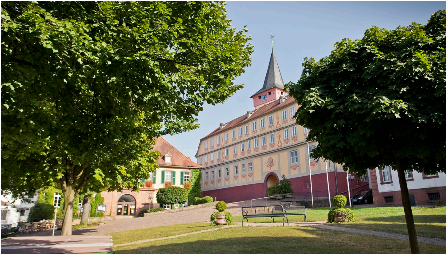
F-V Bad König Altes Schloss.JPG