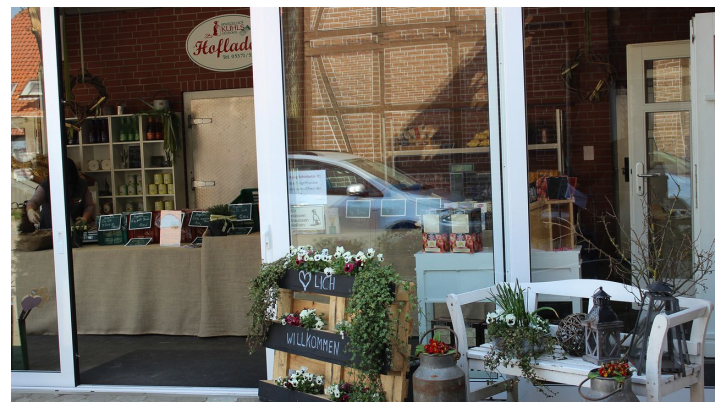
Hofladen Spargelhof Kuhls.jpg