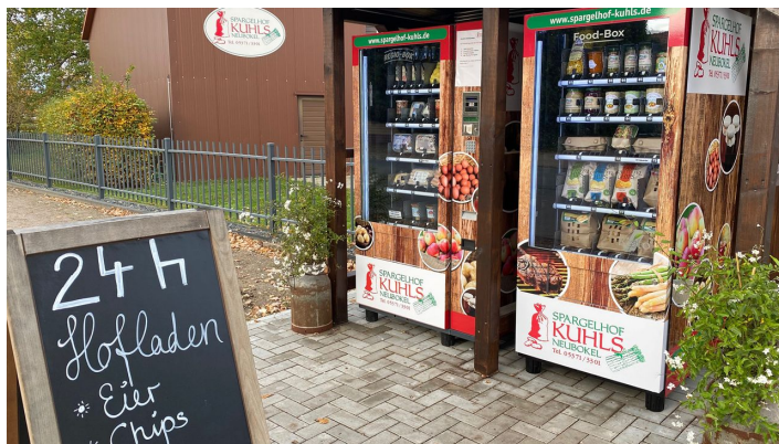
24H Verkaufsautomat Spargelhof Kuhls.jpg

Spargelsaison (ab April bis 24.06.): Täglich: 8:00 - 18:00 Uhr auch an Sonn- und Feiertagen 24h Verkaufsautomat direkt am Hof!