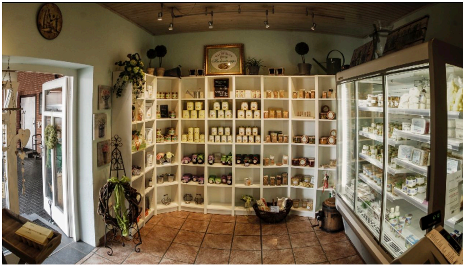
Innenraum Spargelhof Kuhls.jpg