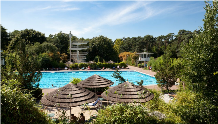
Waldbad in Hilden - © Stadtwerke Hilden GmbH