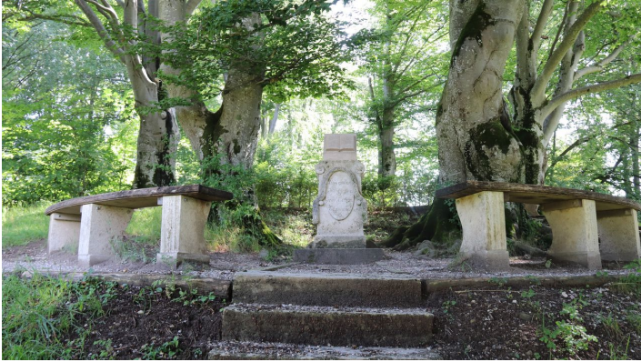
Seidlpark 2.JPG