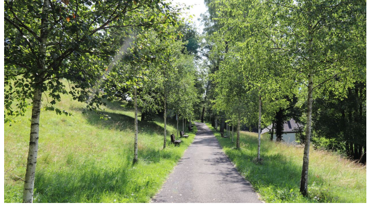
Seidlpark 6 @Carolina Hopen.JPG