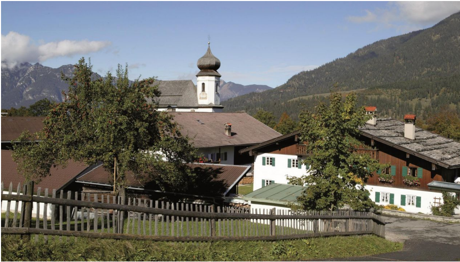
St. Anna Kirche Wamberg