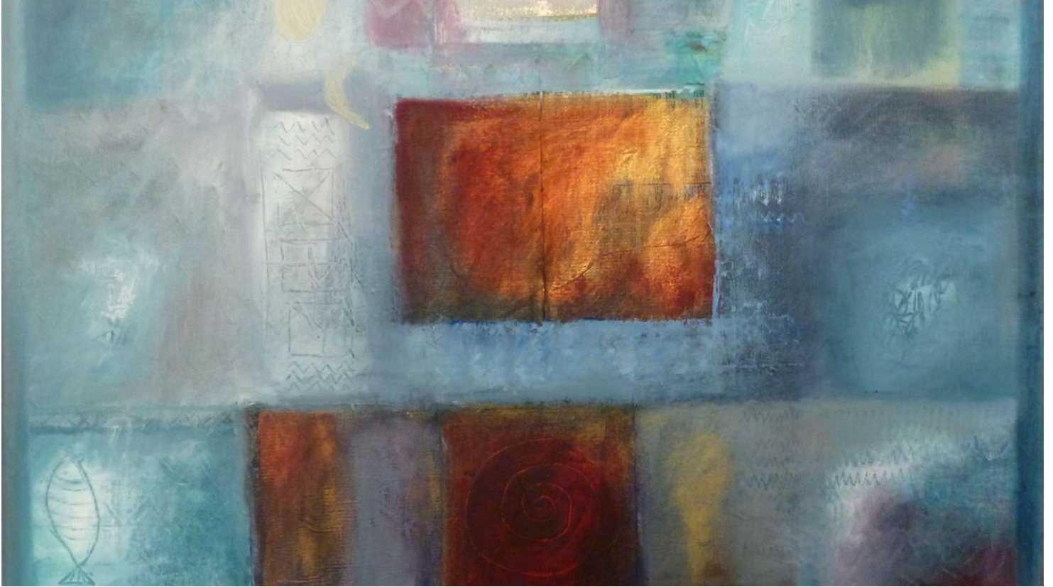
Gina Feder - Fische in Komposition Blau (2).jpg