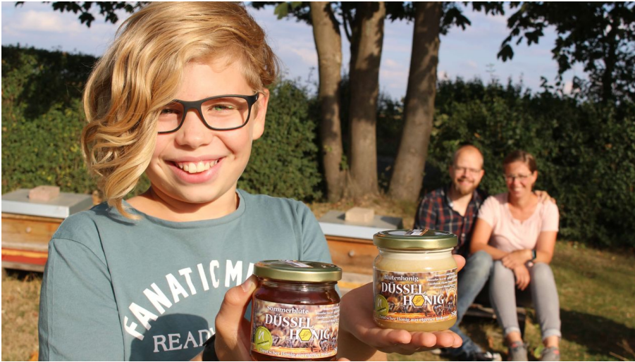
Düffel-Honig aus Wülfrath