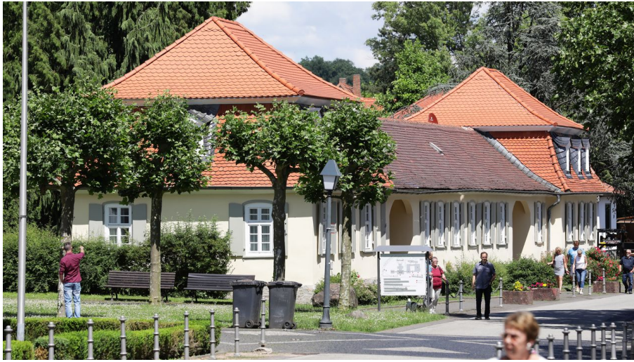
Barockhäuschen Bad Salzhausen