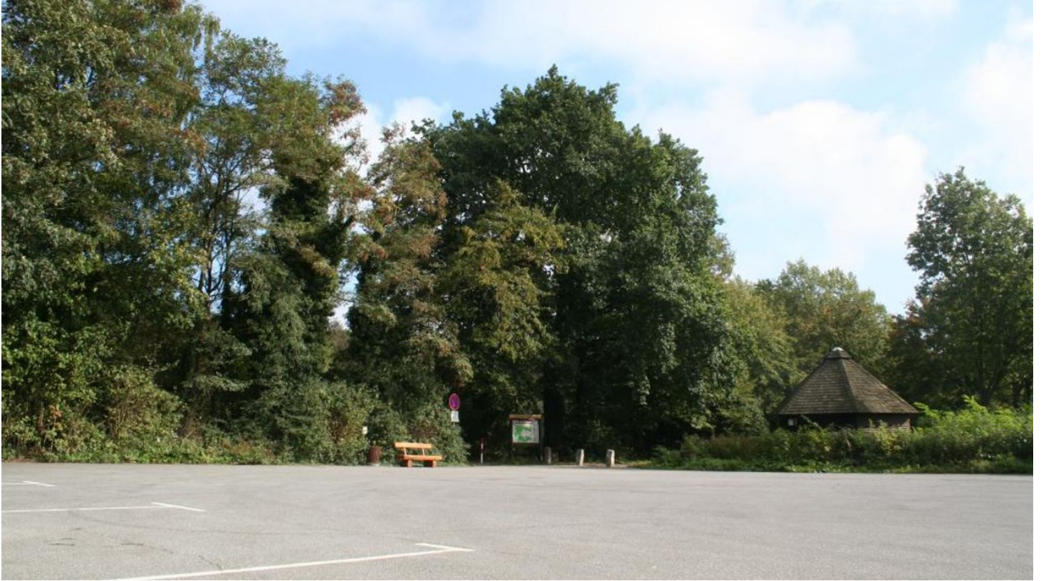
Wanderparkplatz "Schwarzer Brink"