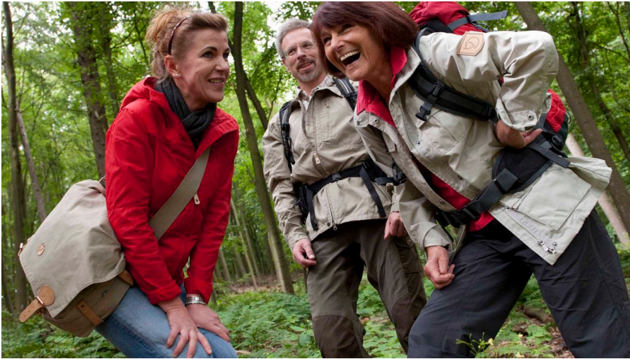
Wandergruppe im Wald