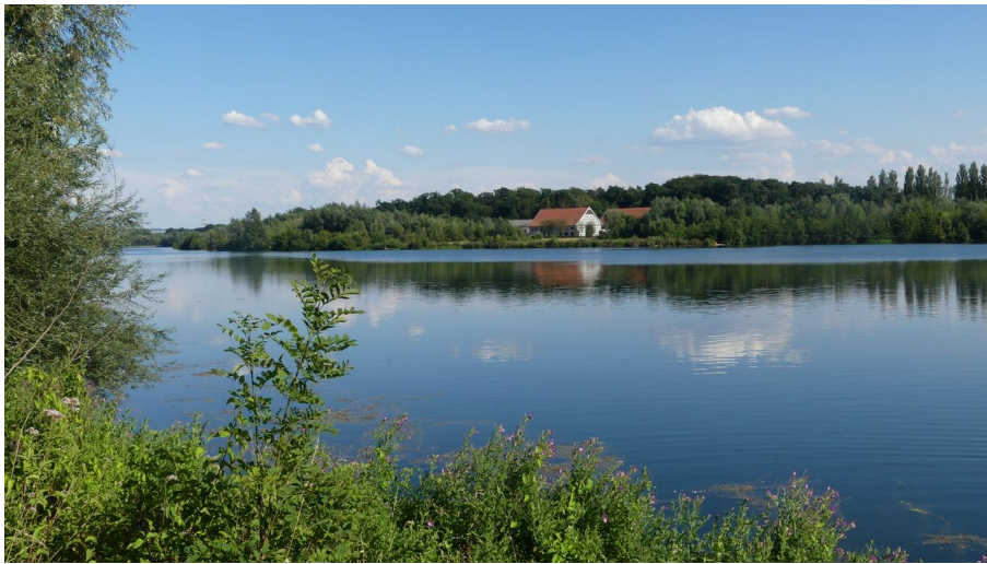
Blick über den Lippesee auf Gut Lippesee