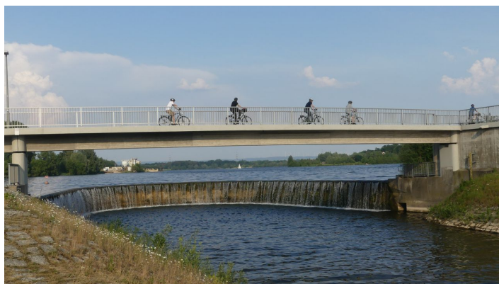
Auslaufbauwerk und Fußgänger-/Radfahrerbrücke