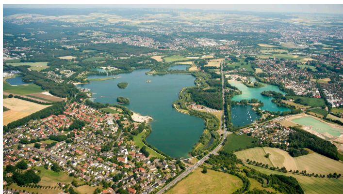
Luftbild: Paderborn-Sande und Lippesee