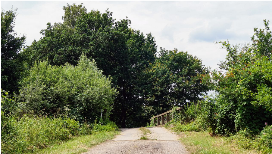
Isebrücke Heidjerpfad Wahrenholz Süd.jpg