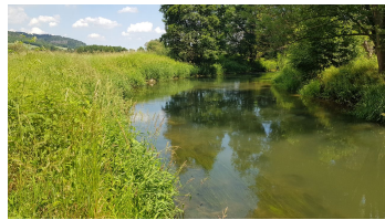
nethe (2).jpg