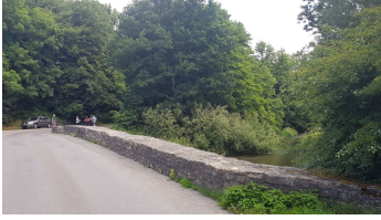
1_hx_rmdn_ (15).jpg