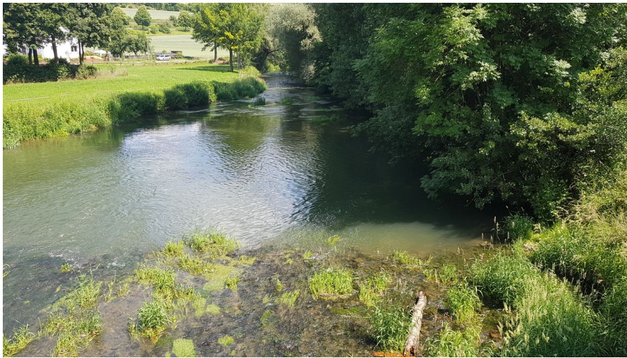
nethe (1).jpg