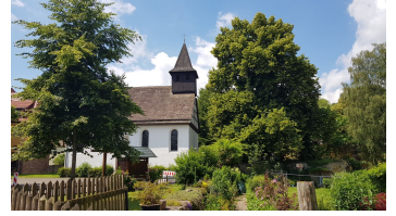
marienkirche_bruchhausen (2).jpg