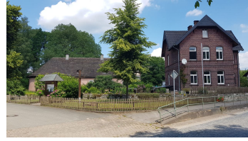
bruchhausen (1).jpg