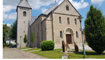
heilig_kreuz_kirche_ottbergen (1).jpg