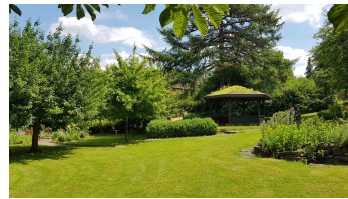
engelgarten_amelunxen (2).jpg