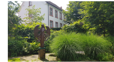
engelgarten_amelunxen (3).jpg