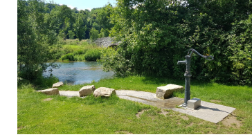
nethe_spielplatz_ottbergen (5).jpg