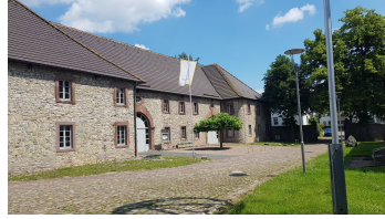
wiemers_meyerscher_hof_ottbergen (1).jpg