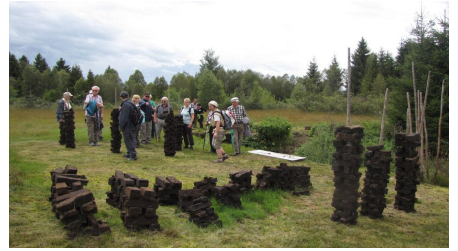
Wanderung - Haselbachweg - © Thorsten Unsel, Bernd Olbrich