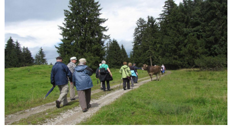
Wanderung - Haselbachweg