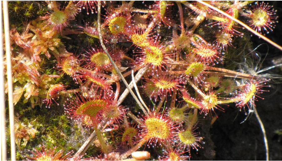
Wanderung - Haselbachweg - Sonnentau am Wegesrand