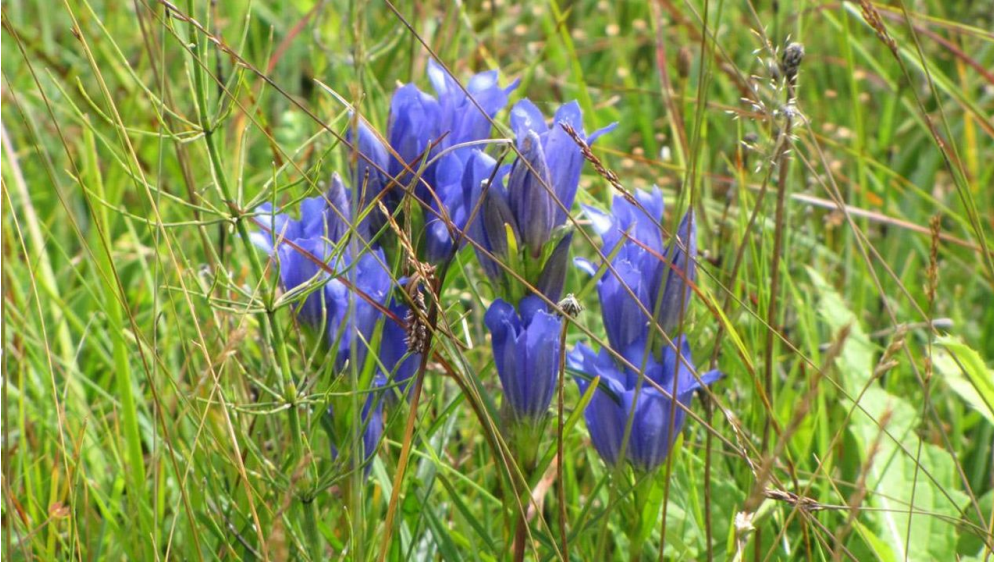
Wanderung - Haselbachweg - Lungenenzian am Wegesrand