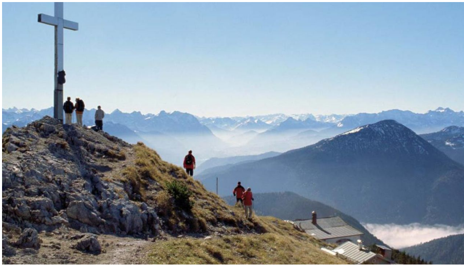
Bergtour Heimgarten über die Kaseralm - Ausblick vom Heimgarten - © Baumgartner