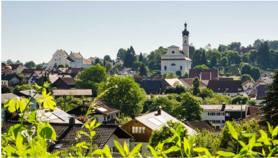
Themenweg - Kunstspaziergang durch Murnau - Das Blaue Land