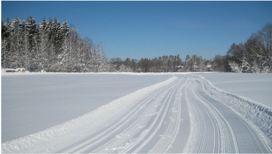
Verbindungsloipe Bad Kohlgrub Saulgrub