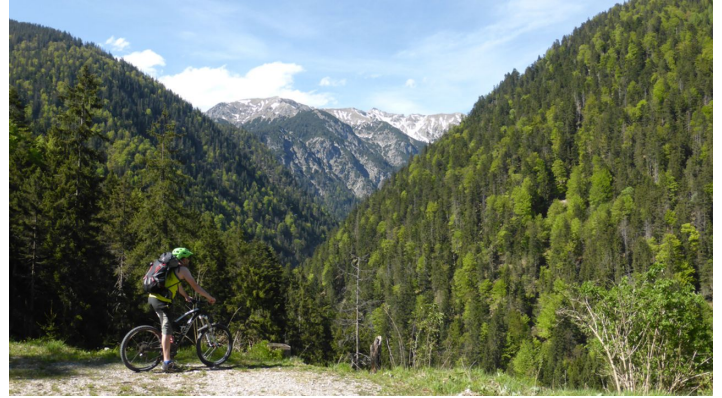
Mountainbiketour - Planseerunde, Blick auf Geierköpfe