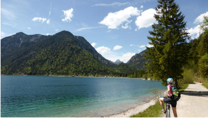
Mountainbiketour - Planseerunde, am Plansee