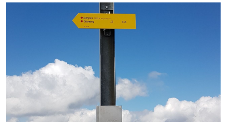
Kienjoch Gipfelkreuz