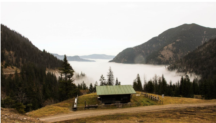
Kienjoch Kuhalm