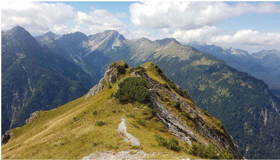
Blick vom Kienjoch