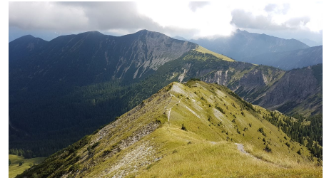
Blick vom Kienjoch