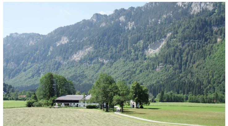
Blick auf das Forsthaus Dickelschwaig.