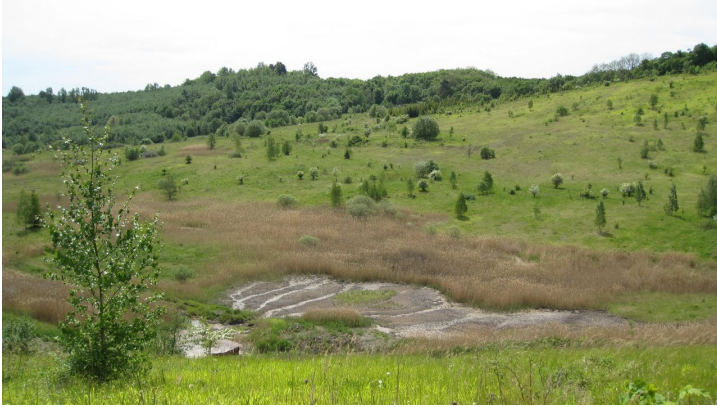
Tagebau Haverlahwiese bei Salzgitter-Gebhardshagen