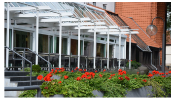
Hotel Ratskeller in Salzgitter-Bad, Sonnenterrasse von außen