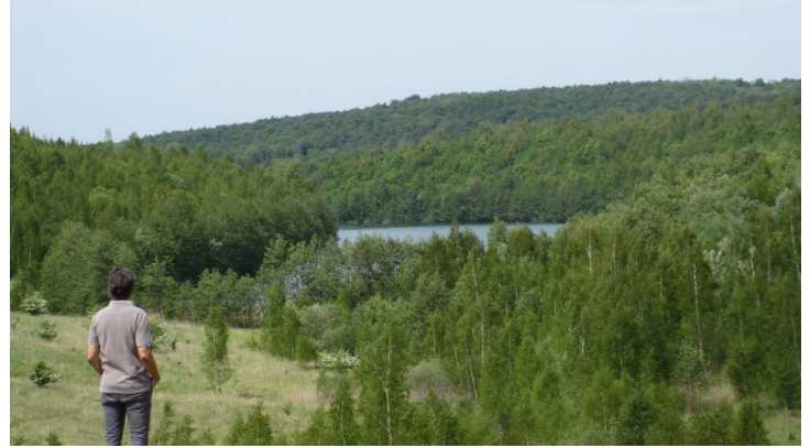
Tagebau Haverlahwiese bei Salzgitter-Gebhardshagen