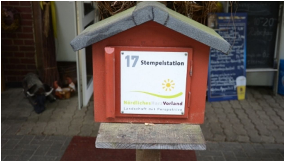
Stempelstelle 17 am Bismarckturm in Salzgitter-Bad

Stadt Salzgitter: Wander- und Fahrradkarte