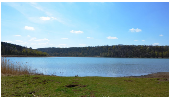
Reihersee Salzgitter, Blick vom Nordufer aus