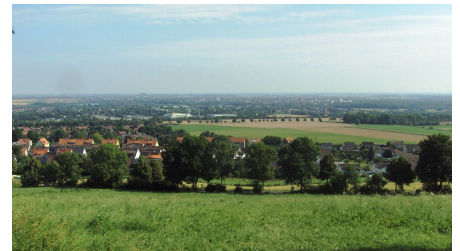
Salzgitter-Lichtenberg, Ausblick von der Kanzel am Wanderparkplatz im Höhenzug