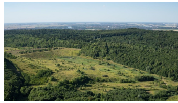
Luftbildaufnahme ehemaliger Tagebau Haverlahwiese bei Salzgitter-Gebhardshagen