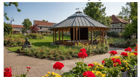
Gradierpavillon im Rosengarten Salzgitter-Bad