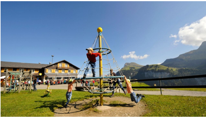
GoldiFamilien-Safari Region Klewenalp