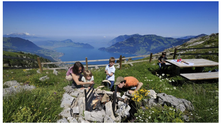
GoldiFamilien-Safari Region Klewenalp