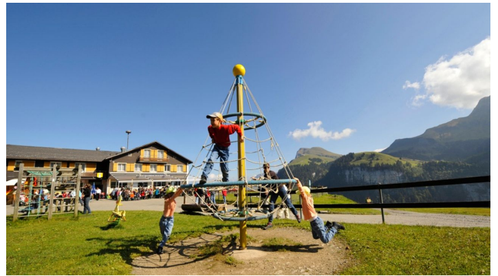
GoldiFamilien-Safari Region Klewenalp