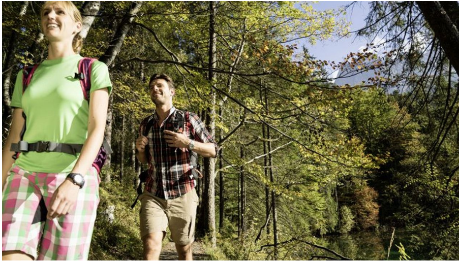
Badersee wandern@ZABT (18).jpg