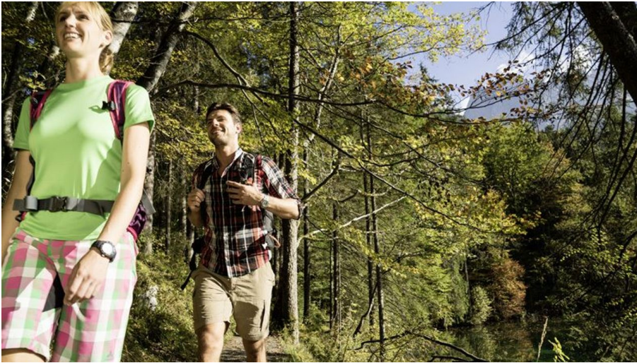
Badersee wandern@ZABT (18).jpg