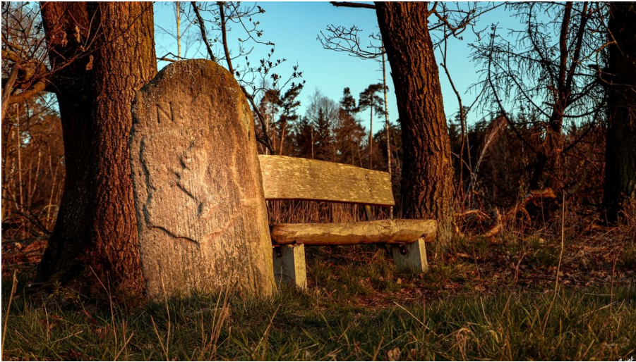
Historischer Grenzstein bei Bad Zwesten